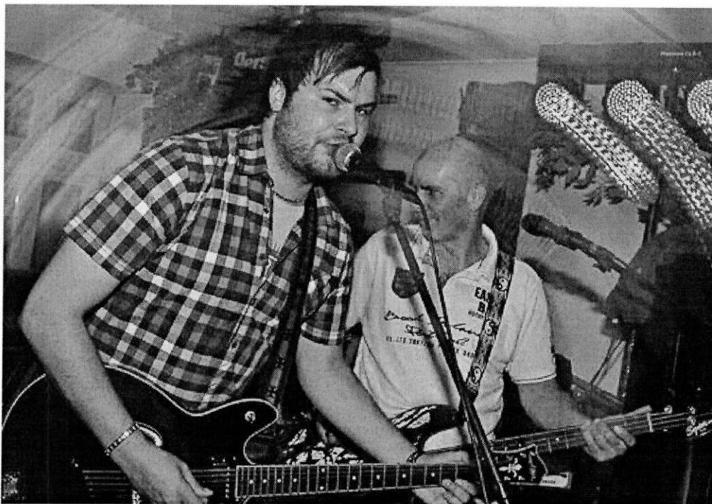
Im Goldenen Engel präsentierte die Formation „Backwater“ rockige Coversongs der vergangenen Jahrzehnte – die Kneipe war wie in den Vorjahren gut gefüllt.